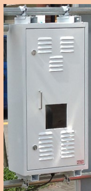
サイネージ 背面写真

壁掛けディスプレイの上下面に、単管パイプに固定可能な単クランプを溶接して提供します。