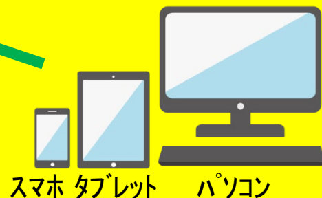
スマホ タブレット パソコン